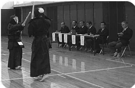
緊張感あふれる実技審査