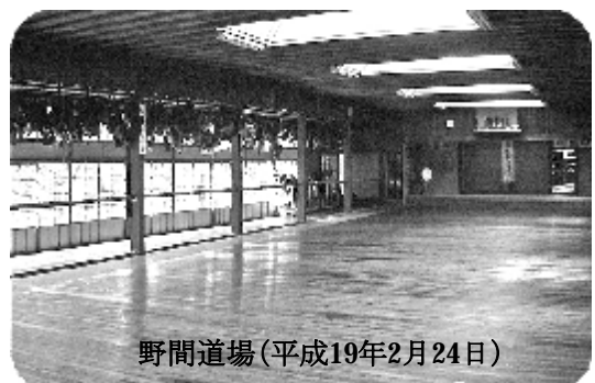
野間道場(平成19年2月24日)

先月の野間道場の話の続きが あります。実は二月二十四日に野 間道場で初めて稽古をしました。 いやあ、感動しました。長い歴史 に裏付けられた重厚さというか、 風格というか、そういうものに圧 倒されました。大学の先輩で野 間道場の朝稽古に通っておられ る方があり、取り壊される前に 一度OBの稽古会を野間道場で やろうということになり、ぼくも 参加できたわけです。普段なら 十人も来ないOB稽古会がこの日 は三十人以上集まりました。 みんな行きたくても敷居が高く て行けなかつたんですね。あそこ れの道場で稽古ができてなんと なく上達したような気がしました。 また、行ってみたいと思いました。 ただ、一人で行くには、やっぱり 思い切り敷居の高い道場なので、 よく知る人に連れて行ってもらわ ないと難しいですね。来年には隣 に今建設中のビルの上階に移転 するそうです。平井