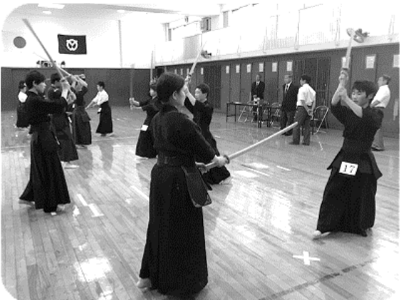
木刀による剣道基本技稽古法