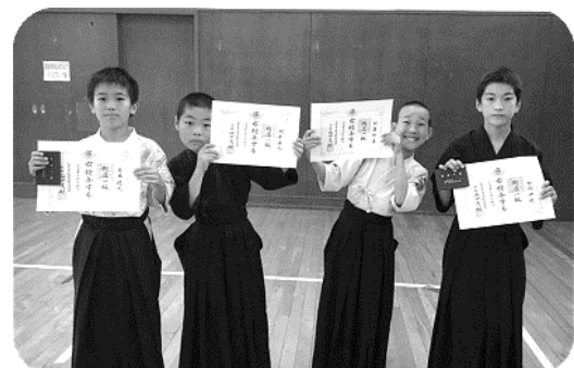
一級合格の皆さん

一級合格おめでとうございます。これから稽古に励み、後輩たちの見本となるようがんばってください。