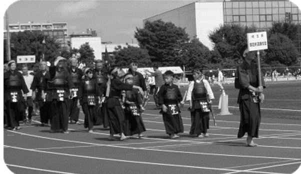
錬成会も行進しました。