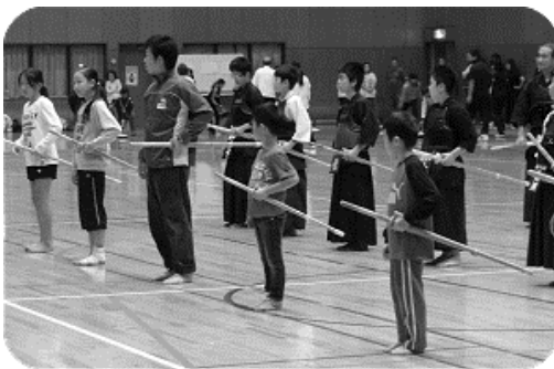
実際に竹刀を持って体験しました

十月十九日に朝霞市体育協会主催で小学生とその保護者対象に第十二回スポーツサーキットが開催され、剣道も実施しました。当日は大勢の方が剣道を体験しました。この中から入会者がたくさん出てほしいですね。少年部のみなさん、先生方、後援会のみなさん、お疲れ様でした。