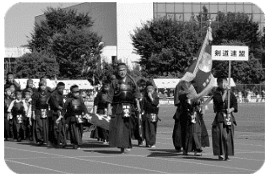
晴天の中、堂々と更新しました

十月十三日、中央公園陸上競技場で市民総合体育祭が実施されました。恒例のパレードでは市武道館、錬成会合同で行進しました。 錬成会も一緒に行進