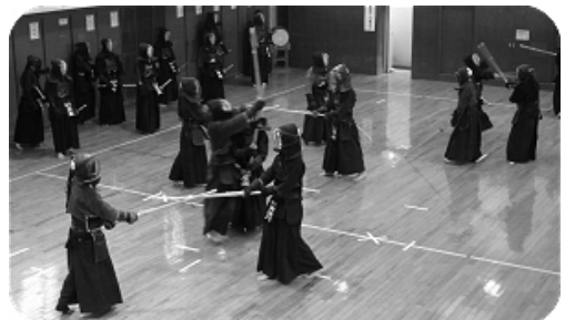
元氣いっぱい。こどもたちには負けません。