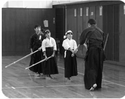
しつかり構えていますね。やはり基本が大切です。

平成二十四年もあとわずかとなりました。みなさんにとって今年はどうな年でしたか。また剣道の方も稽古は十分にできましたでしょうか。 今月号は朝霞市剣道連盟の普段の稽古風景を掲載しました。この日は月に一度の錬成会との合同稽古ということもあり、いつも以上に活気あふれる稽古となりました。 「最近剣道の稽古してないなあ。」と思っている方がおられましたら、いつでも足を運んで下さい。お待ちしております。ともに良い汗をかきましょう。