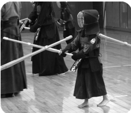
上級の部なりたて。けれども気合と元気さでは負けません。

平成二十四年もあとわずかとなりました。みなさんにとって今年はどうな年でしたか。また剣道の方も稽古は十分にできましたでしょうか。 今月号は朝霞市剣道連盟の普段の稽古風景を掲載しました。この日は月に一度の錬成会との合同稽古ということもあり、いつも以上に活気あふれる稽古となりました。 「最近剣道の稽古してないなあ。」と思っている方がおられましたら、いつでも足を運んで下さい。お待ちしております。ともに良い汗をかきましょう。