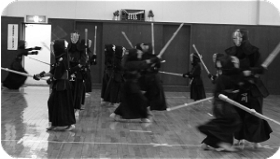
一般の先生方も面をつけての熱血指導です。