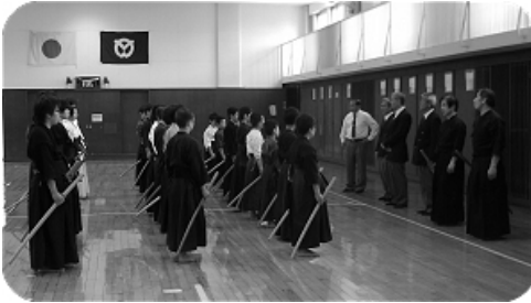
受審者のみなさん