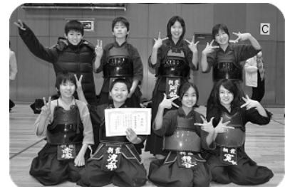
三位入賞メンバー

5チームによる総当たりリーグ戦 2勝2敗 対和光市剣道連盟 2勝3敗で負け ●● 対新座剣友会 1勝2分2敗で負け ●● 対尚武剣友会 2勝3分で勝ち ○○ 対錬成会 2勝2分1敗で勝ち ○○