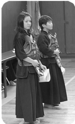
胴争奪試合 男女優勝者