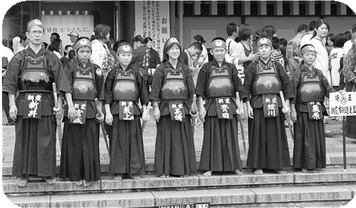
Bチームのメンバー

正しい姿勢で、大きく、強く、速く、そして美しくと取り組んで来た事に間違いは無く、結果程に大差があるとは思っていません。これから新しい課題に一つ一つ挑戦して、より良い剣道を目指して行きたい。最後に、今回も会員の皆様、後援会の皆様には大変お世話になりました。今後とも子供達の成長を、共に温かく支えて行きましよう。有難うございました。