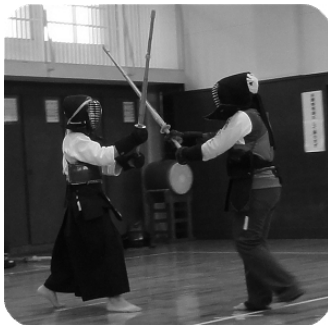
四将 富岡 対 母

四月三日に六年生を送る会を実施しました。六年生の形の披露で 始まり一般会員と朝剣OBとの対試合、六年生とご父兄による親子 対決が行われました。写真はそのときの様子です。その後、六年生 からご父兄へ一人ひとり感謝の手紙を手渡しました。最後にお世話 になった指導部の先生方へ感謝の気持ちを贈り締めくくりました。