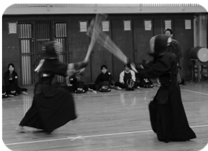
大将 敷上 対 父