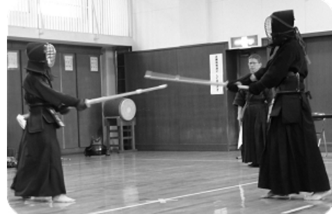
三将 濱田 対 父