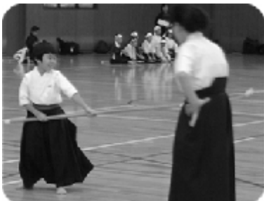
なぎなた大会の様子 合わせてなぎなた大会も実施されました。