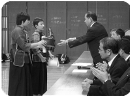
胴争奪試合優勝者