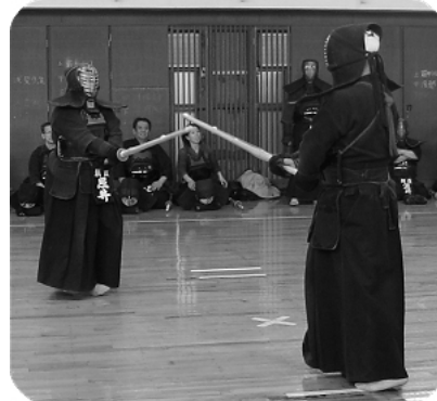
平成20年納会試合の様子(全員での紅白戦)