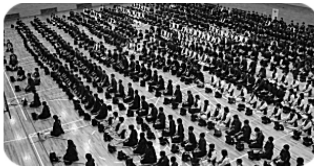
埼玉大学寒稽古の様子

年明け早々、非常に寒い中、それも早朝からにもかかわらず、大勢の参加者で埼玉大学の体育館は、熱気であふれました。当道場からも多くの人たちが参加しましたが、新しい一年を始めるにあたり、何か掴む物があつたのではないのでしょうか。引率された先生方、ご父兄の皆様、お疲れ様でした。