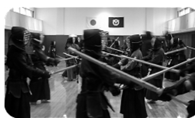
明大生田との合同稽古の様子

今年も明大生田との合同稽古会を行ないました。若い剣士達の気合で武道館も熱気に溢れた一日となりました。朝剣会員にもよい刺激となつたのではないのでしょうか。