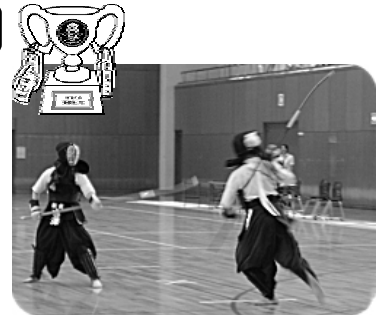
なぎなた大会の様子