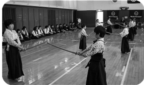
42期生お披露目の様子

42期生のお披露目は、41期生の一部とともに「足さばき」の披露を行いました。42期生は、朝剣に入って約1ヶ月が過ぎ、ようやく立ち居振る舞いも形になってきました。これからがんばって続けてくれると思います。あたたかく見守っていききたいですね。