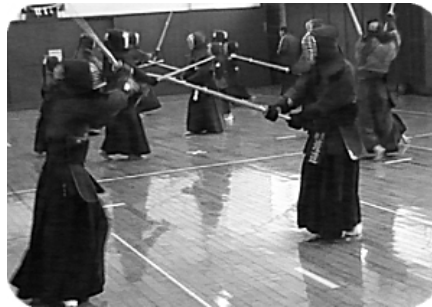
熱気あふれる寒稽古

特に10日の寒稽古は錬成会と合同で行われ、多数の参加がありました。(上記写真 於：朝霞市武道館)