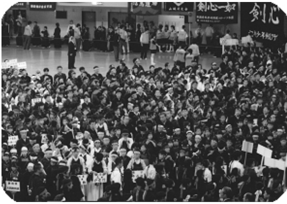
全国から大勢の選手たちが集まりました。すごい熱気ですね。