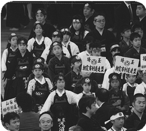
われらが朝剣の選手たちも堂々の入場です。みんな元気一杯ですね。