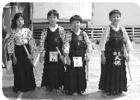
寒稽古の様子(朝霞三中で)

寒稽古の締めくくりとして寒稽古納会試合が実施されました。熱気あふれる戦いが繰り広げられ、厳しかった寒稽古の成果をいかに発揮しました。