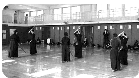
6年生による日本剣道形演武