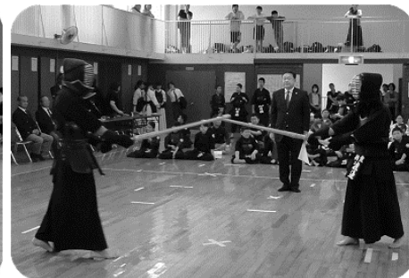
一般三段以下の部