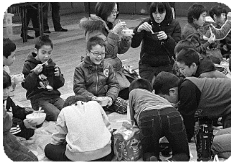
皆でお汁粉をいただきました。