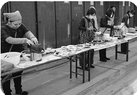
後援会の皆様、ありがとうございました。

1月14日に恒例の鏡開きを行いました。全員での合同稽古、一般の稽古の後、皆でお汁粉をいただき、今年一年間の無病息災を祈念しました。また、朝霞市剣道連盟から紅白のお餅が配られました。