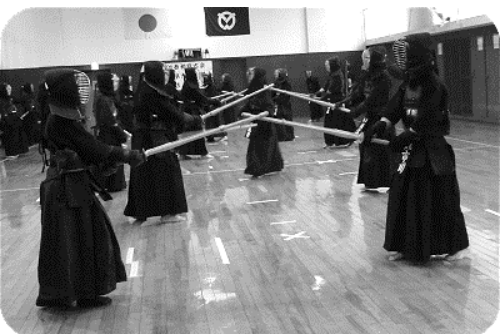
合同稽古の様子 新春から 熱気があふれました。

一月六日、朝霞、志木、和光、新座四市の新年初稽古会を 市武道館で行いました。大勢の参加者で活気のある新年の 初稽古会となりました。