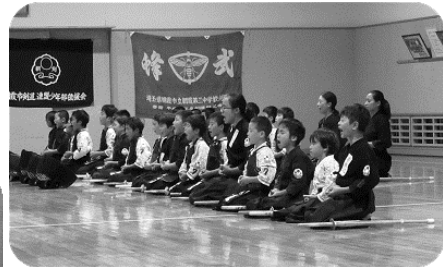
少年の部全員で「剣道五誓」

今年も暑中稽古を実施しました。特に、七月三日から八日までは朝霞二中の道場で行いました。皆勤者のみなさん、暑い中、よくがんばりました。