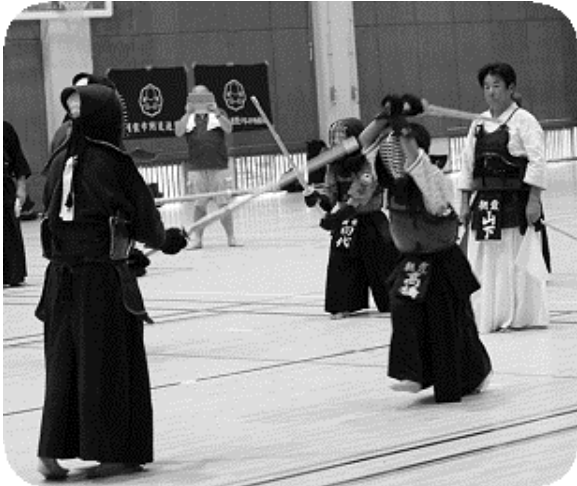
錬成大会組 模擬試合

今年も七月十五日から十七日まで草津で合宿を行いました。例年と同じく涼しい高地で、錬成大会出場組、年少組、一般に分かれて厳しい稽古を行いました。充実した稽古と、そして、楽しい三日間でした。