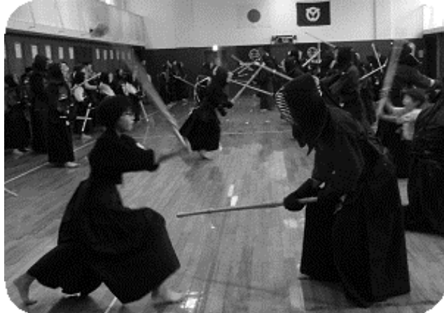
一般の部、少年の部合同稽古

一月九日に恒例の鏡開きを行いました。全員での合同稽古、一般の稽古の後、後援会のお母様方に作っていただいたお汁粉をいただきました。今年一年間の無病息災を祈念しました。また、朝霞市剣道連盟から紅白のお餅が配られました。