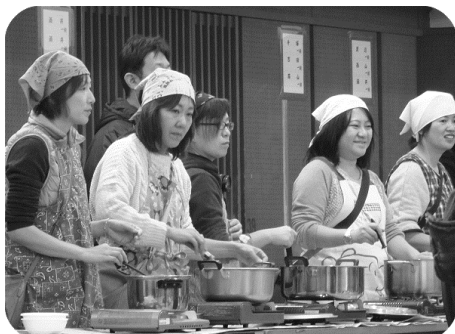
後援会のお母様方

3月6日、13日に剣道連盟会費及び傷害保険料の納付受付を行います。宜しくお願いします。