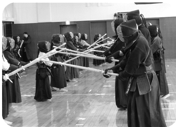
一般の部、少年の部合同稽古

平成二十八年の最初の行事として一月十一日に鏡開きを行いました。最初に全員での合同稽古、そのあと一般の稽古を行い、最後に後援会のお母様方に作っていただいたお汁粉をいただき、今年一年間の無病息災を祈念しました。また、朝霞市剣道連盟から紅白のお餅が配られました。