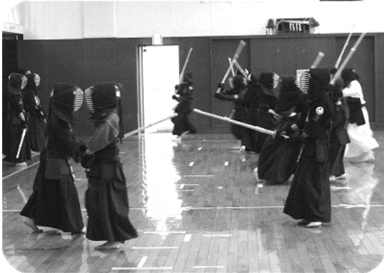
上級の部、五角稽古。力が入ります。