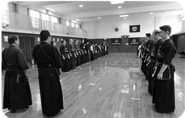
出席者全員での紅白試合

平成二十六年の納会稽古を十二月二十一日に行いました。少年の部、一般の部の合同稽古の後、全員による紅白戦を行いました。