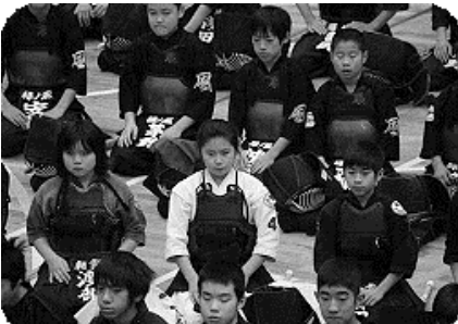
大勢の寒稽古参加者の中で