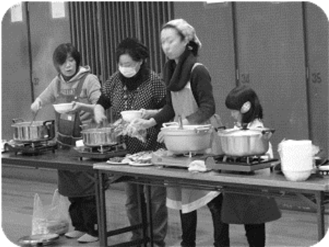
後援会のお母様方

平成二十七年の最初の行事として一月十二日に鏡開きを行いました。最初に全員での合同稽古、そのあと一般の稽古を行い、最後に後援会のお母様方に作っていただいたお汁粉をいただき、今年一年間の無病息災を祈念しました。また、朝霞市剣道連盟から紅白のお餅が配られました。