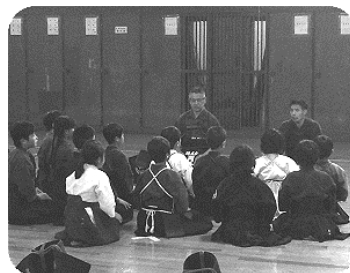
(錬成会との合同稽古後)