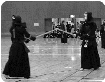
一般男子 四、五段の部