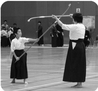
なぎなた大会の様子