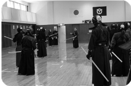
内田先生のご指導による 基本技の稽古風景