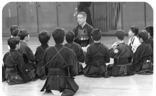
稽古の後、錬成会の岡崎先生のお話しに耳を傾ける朝剣のこどもたち

少年部では、毎月一回、朝霞剣道錬成会との合同稽古を行なっています。合同稽古の日は、どちらの道場のこどもたちも普段に増して気合が入ります。これからもお互い切磋琢磨しながら、成長していければ良いですね。