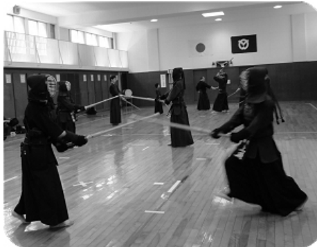
自主稽古に励む一般会員

朝霞市剣道連盟の今年度の新しい取り組みとして、日曜日の稽古最後の十五分を使って、七段の先生のご指導による基本稽古を行なっています。そのような取り組みの効果か、稽古終了後も技の稽古や形の稽古など、自主稽古に励む人達が増えていきます。