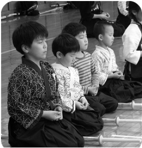
先輩たちといっしょに 剣道五誓の唱和