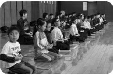
上：先輩たちといっしょに剣道五誓の唱和。 右：お待ちかね。実際に竹刀を持つ稽古。