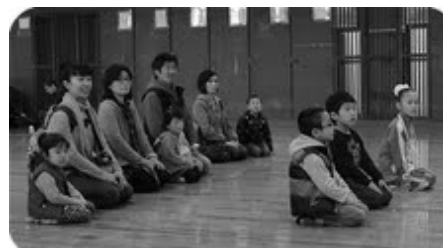
入会式の様子。真剣に耳を傾けていました。

四月一日に平成二十四年度四十六期生の入会式を朝霞市武道館で行いました。入会式には三名の入会者がありました。大変緊張する中、皆、先生方のお話を真剣な表情で聞いていました。最後は一人ひとり、しっかりと自己紹介を行いました。