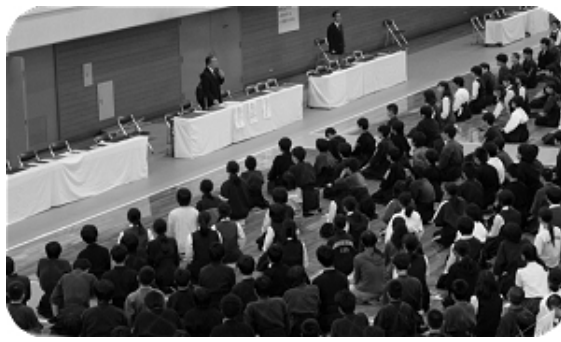
初段～三段 昇段審査 戸田スポーツセンター

六月十二日、戸田スポーツセンターにおいて初段～三段の審査会が埼玉県剣道連盟主催で行われました。朝剣会員の他、朝剣出身の中学生も多数受審しました。合格されたみなさん、おめでとうございます。