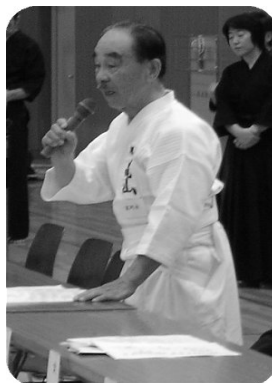
朝霞地区剣道大会 審判長(二〇〇八年)

かねてからご療養中でしたが、12月12日ご逝去されました。 享年八十歳。謹んでご冥福をお祈り申し上げます。