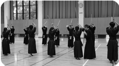
熱心に取り組む受講生