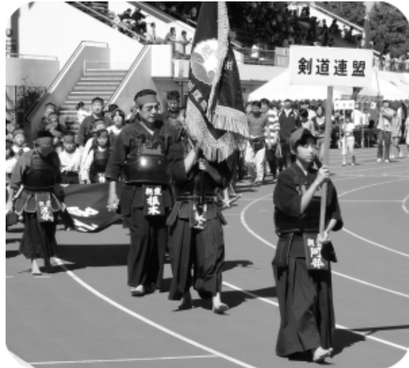
堂々で行進する朝霞市剣道連盟

十月十一日、中央公園陸上競技場で市民総合体育祭が実施されました。恒例のパレードでは市武道館、錬成会合同で行進しました。