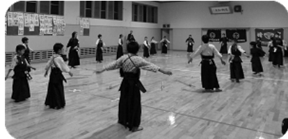
上級の部(朝霞三中)