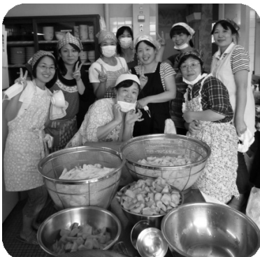
夏季合宿で大活躍のおかあさん方

今回の合宿でも後援会のみなさんには大変お世話になりました。特に毎年七月は行事が目白押しで大変だと思ひます。これからも朝霞市剣道連盟のために宜しくお願いします。