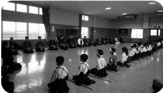
緊張感が伝わります