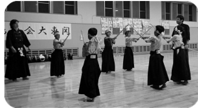
初級の部(朝霞三中)