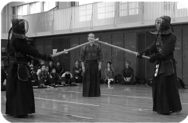
納会稽古を締めくくる模範試合

両先生の厳しい攻め合いに、道場全体に緊張感があふれました。立会は千葉先生がされました。